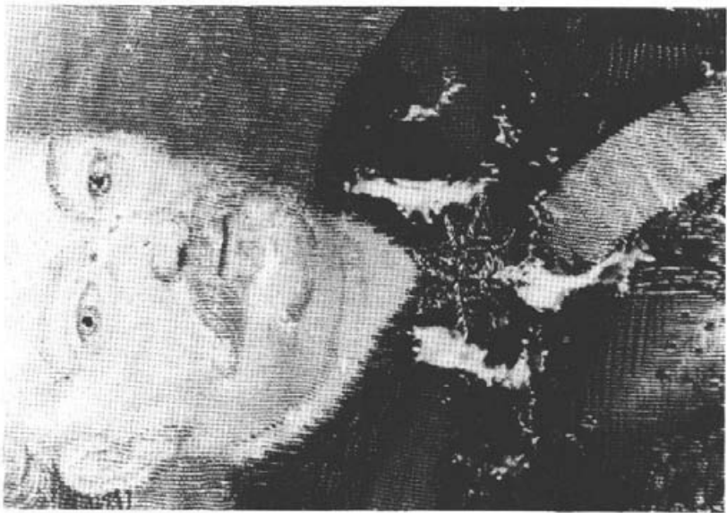
13. Fragment portretu przed konserwacją.