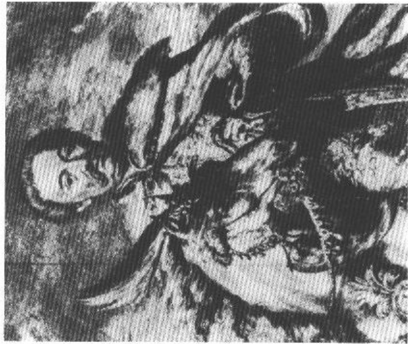
5. Romeyn de Hooghe. Fragment ryciny 'Jan III na tle bitwy chocimskiej'.