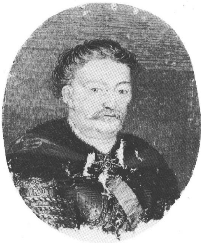
10. Gobelinowy portret Jana III, przed konserwacją.