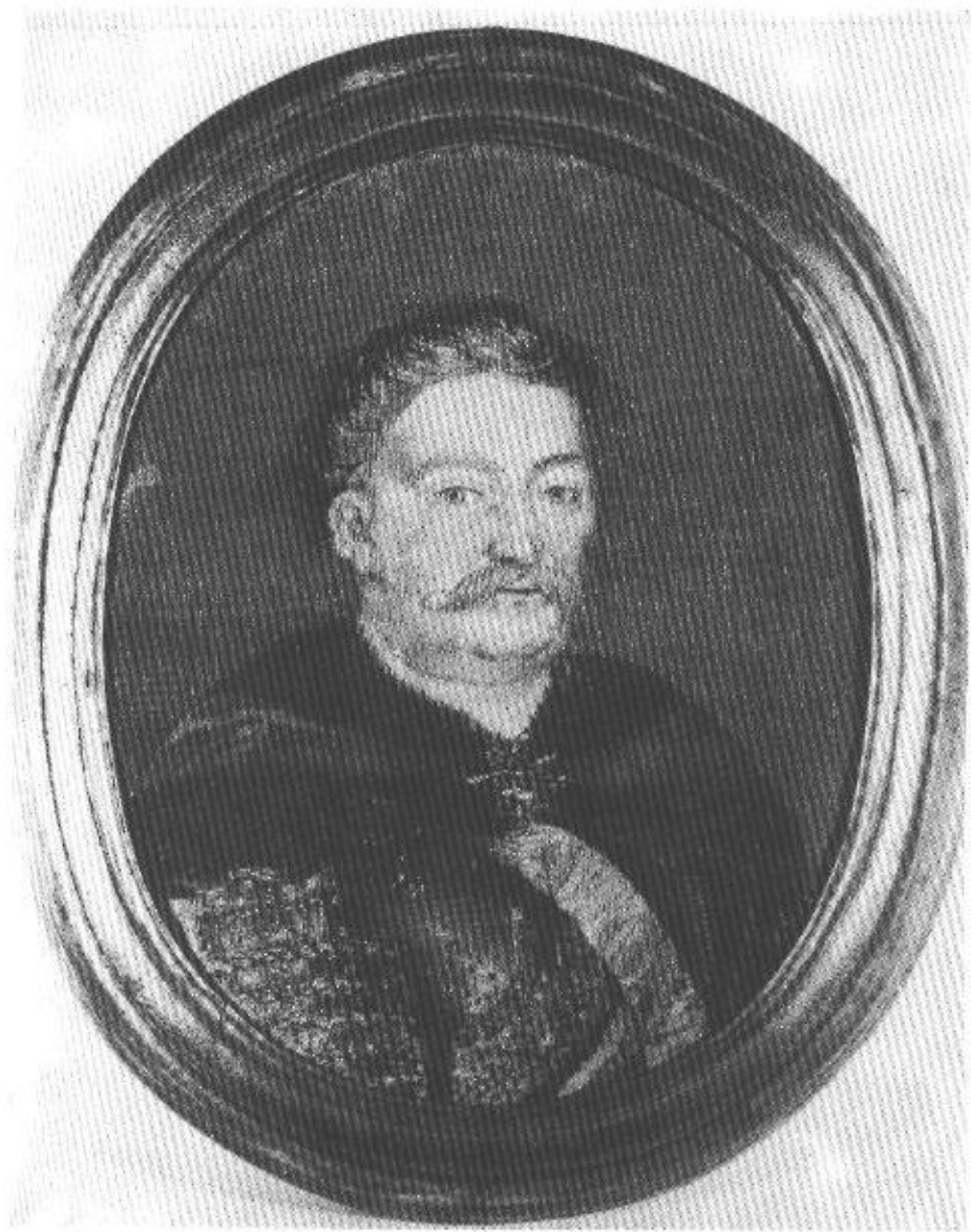
I. Gobelinowy portret Jana III, po konserwacji.