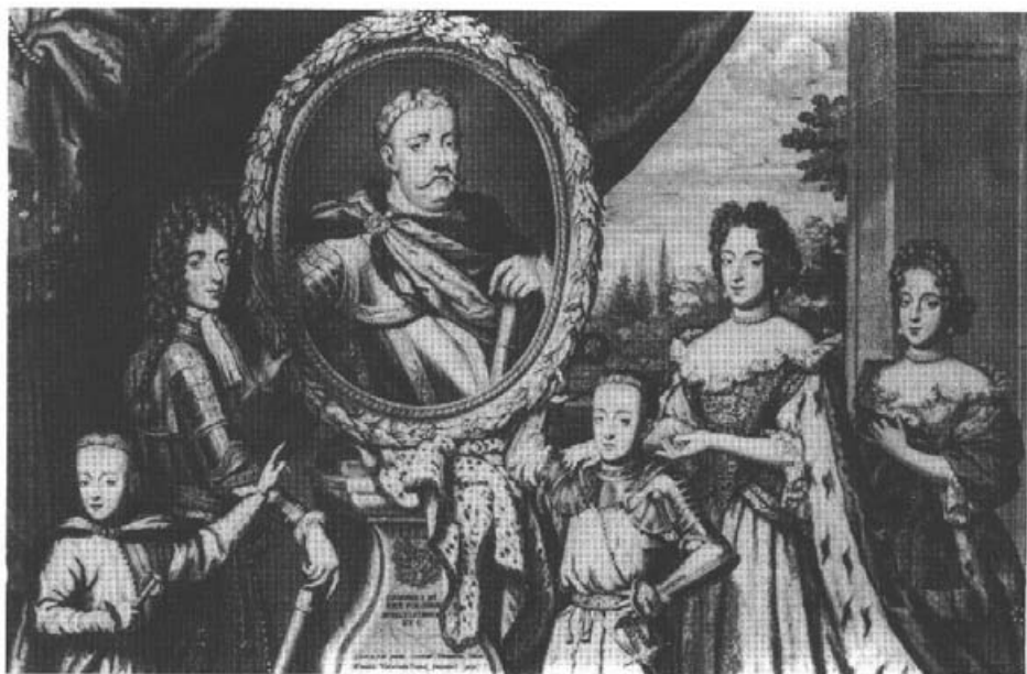
8. Benoit Fariat wg H. Gascara. Portret rodziny Sobieskich. Miedzioryt.