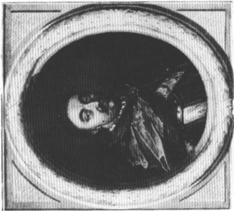
3. Pieter Stevens (Stephani) mł. Portret Jana III. Miedzioryt.