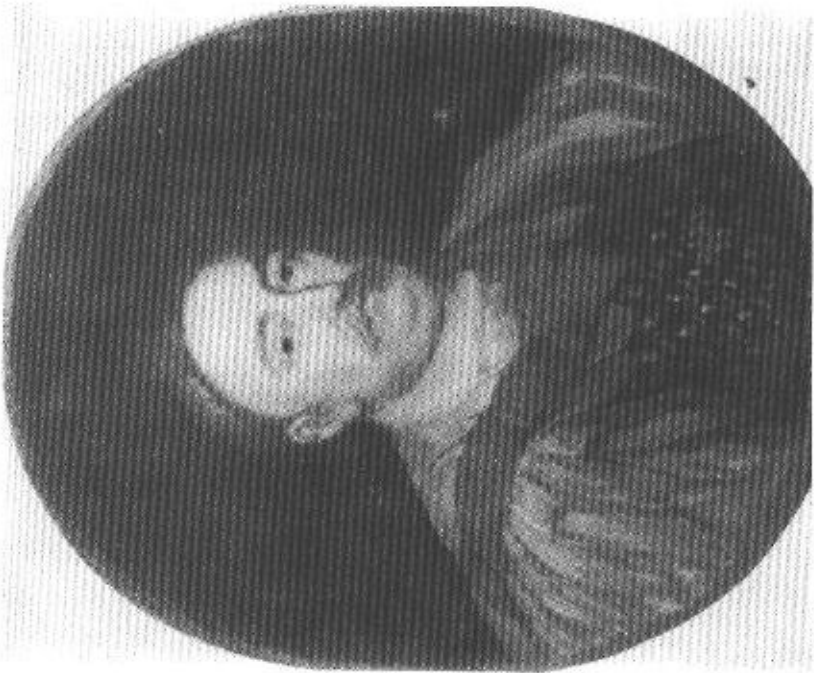
4. Jerzy Eleuter Siemiginowski? Portret Jana III.