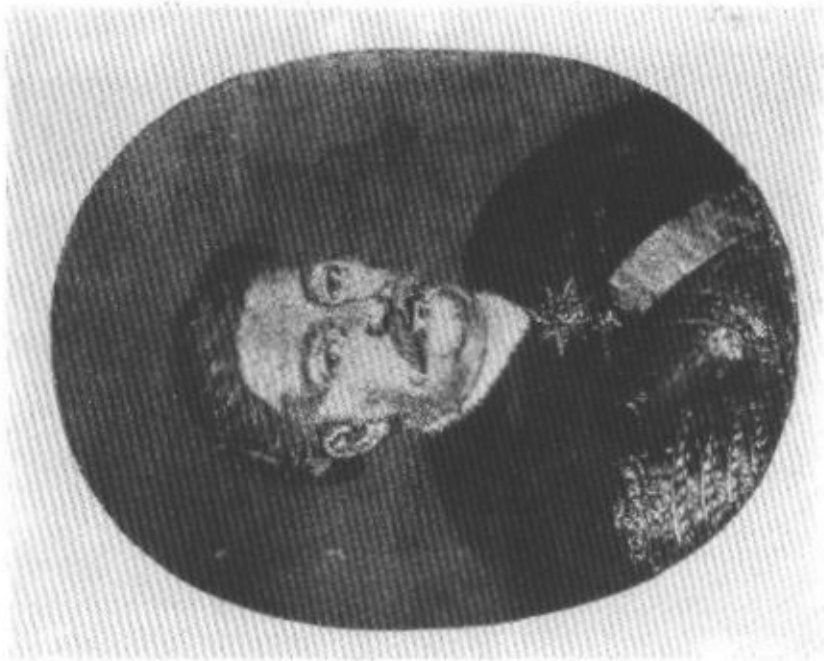
2. Gobelinowy portret Jana III (wg Pągaczewskiego, Gobeliny polskie).