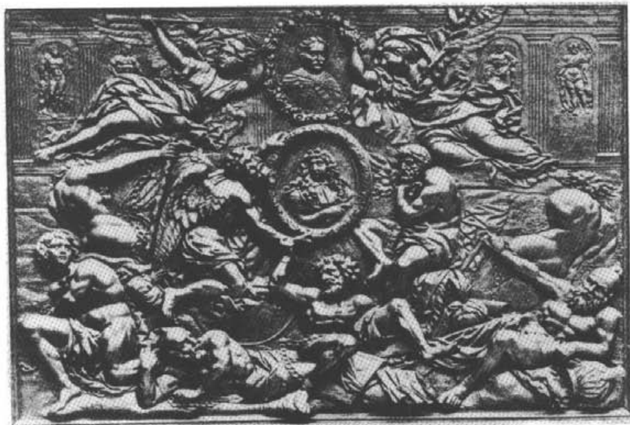
6. Pierre Vaneau. Płycina z cokołu pomnika Jana III. Relief w drewnie.