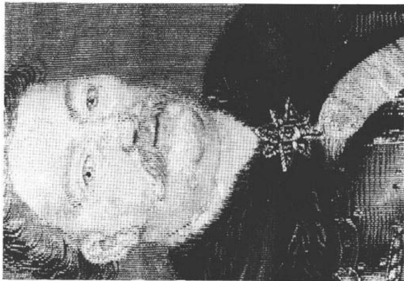
14. Fragment portretu po konserwacji.