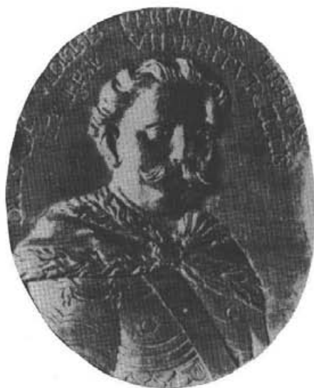
7. Fragment: portret Jana III.