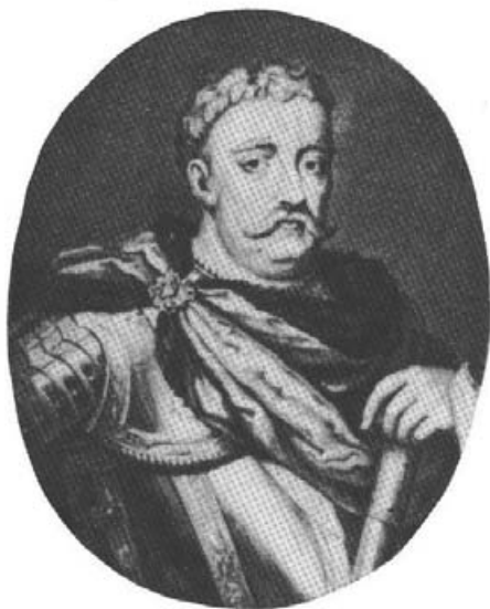
9. Fragment: portret Jana III.