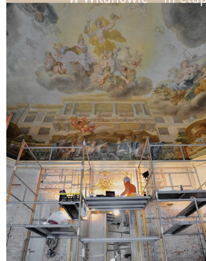
Muzeum Pałac w Wilanowie

→ Rewitalizacja i digitalizacja XVII-wiecznego zespołu pałacowo-ogrodowego w Wilanowie – III etap