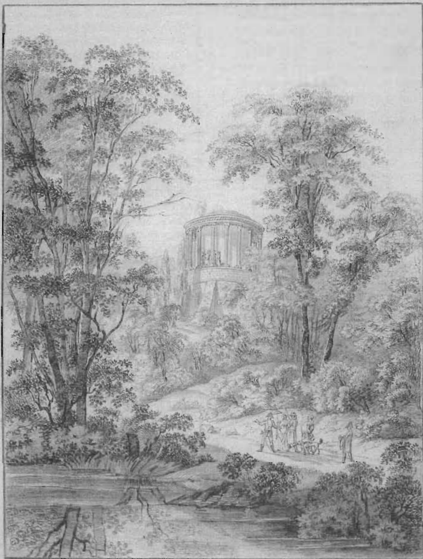
Świątynia Sybilli w Puławach.