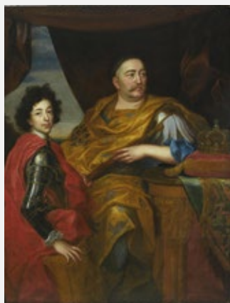
Jan III z synem Jakubem Ludwikiem, Jerzy Eleuter Szymonowicz-Siemiginowski, ok. 1690, Muzeum Pałacu Króla Jana III w Wilanowie