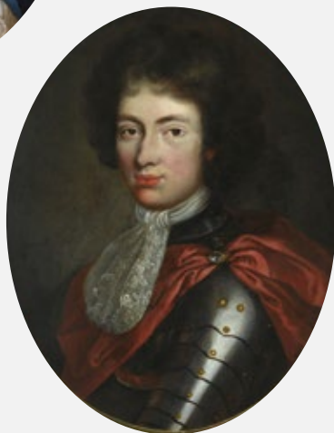
Jakub Ludwik Sobieski, malarz francuski działający w Polsce, ok. 1685, Muzeum Pałacu Króla Jana III w Wilanowie

Znajdują się wśród nich m.in. uważana za zaginioną korespondencja Marii Kazimiery z Janem Sobieskim, doniesienia dyplomatów i agentów Jana III z różnych stolic europejskich, a także korespondencja rodzinna Marii Kazimiery, prowadzona już po śmierci króla. Właśnie ta korespondencja królowej stała się pierwszym polem wspólnych działań naukowych Muzeum oraz Archiwum. Wsparcie Ministerstwa Kultury i Dziedzictwa Narodowego umożliwiło rozpoczęcie prac nad wykonaniem odpisów, tłumaczeń oraz edycją źródeł pod kątem ich przyszłego wydania.