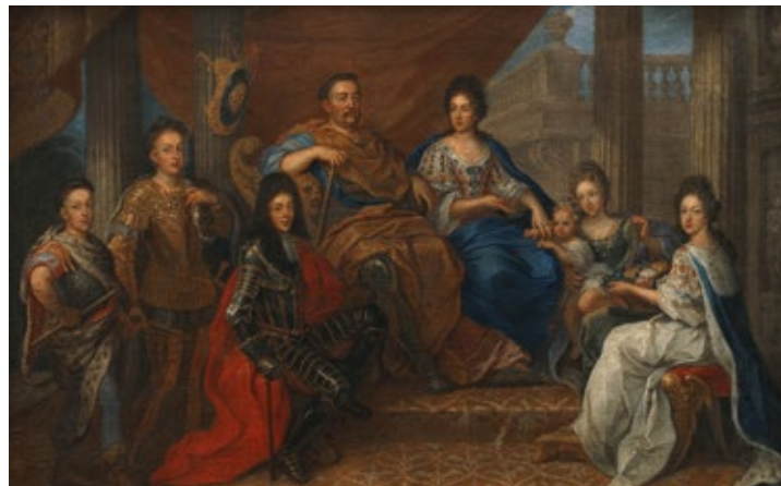
Jan III w otoczeniu rodziny, malarz dworski, po 1693, Muzeum Pałacu Króla Jana III w Wilanowie

W zasobach mińskiego Archiwum znajdują się m.in. dwa bezcenne zespoły dokumentów: archiwum Sobieskich z Oławy (fond 695) i olbrzymi fragment Archiwum Radziwiłłów z Nieświeża (fond 694), w skład którego weszło archiwum żółkiewskie Sobieskich. Archiwum oławskie przez wiele lat uważano za bezpowrotnie utracone podczas walk w Berlinie w 1945 roku. Tymczasem okazało się, że po zdobyciu stolicy III Rzeszy przez Armię Czerwoną trafiło ono najpierw do Moskwy, a następnie do Mińska. Kilkanaście lat temu możliwe stało się ujawnienie jego obecności. Wkrótce potem archiwiści z Mińska starannie opracowali materiały tego zespołu, który zaczął figurować pod sygnaturą: fond 695. Już pierwsze, sondażowe kwerendy ukazały wielką wartość dokumentów.