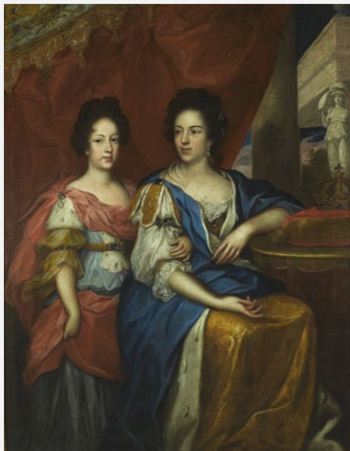
Maria Kazimiera z córką Teresą Kunegundą, Jerzy Eleuter Szymonowicz-Siemiginowski, ok. 1690, Muzeum Pałacu Króla Jana III w Wilanowie