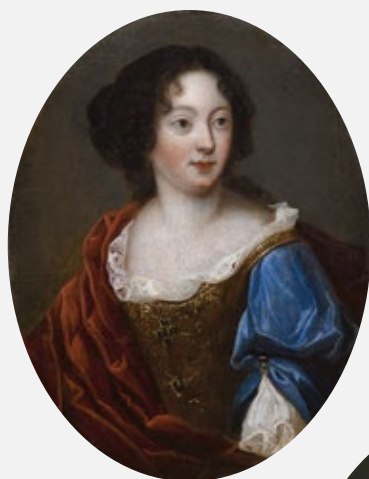
Teresa Kunegunda Sobieska, malarz francuski, przełom XVII/XVIII, Muzeum Pałacu Króla Jana III w Wilanowie