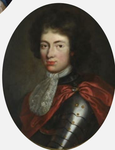
Якуб Людвік Сабескі, французскі мастак, які працаваў у Польшчы, каля 1685, Музей Палаца Караля Яна III у Вільянуве

Супрацоўніцтва Музея Палаца Караля Яна III у Вільянуве з Нацыянальным гістарычным архівам Беларусі ў Мінску з'яўляецца важным раздзелам у сферы двухбаковых беларуска-польскіх навуковых праектаў. Яго мэтай з'яўляецца аблегчэнне доступу і распаўсюджванне ведаў аб малавядомых альбо зусім невядомых архіўных крыніцах, якія тычацца каралеўскага роду Сабескіх, і ўяўляюць надзвычай каштоўную супольную спадчыну народаў колішняй Рэчы Паспалітай. Рэалізацыя гэтага праекта была б немагчымай без прыязнага і адкрытага стаўлення Пасольства Рэспублікі Беларусь у Варшаве і Нацыянальнага гістарычнага архіва Беларусі ў Мінску, а таксама шырокай, не толькі фінансавай, падтрымкі Міністэрства Культуры і Нацыянальнай Спадчыны.