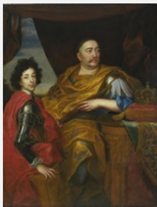
Ян III з сынам Якубам Людвікам, Ежы Элеўтэр Шымановіч-Семігіноўскі, каля 1690, Музей Палаца Караля Яна III у Вільянуве