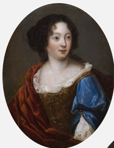
Тэрэза Кунегунда Сабеская, французскі мастак, мяжа XVII/XVIII стагоддзяў, Музей Палаца Караля Яна III у Вільянуве