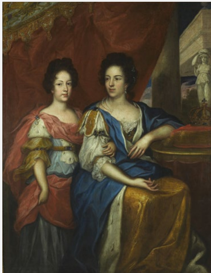
Марыя Казіміра з дачкой Тэрэзай Кунегундай, Ежы Элеўтэр Шымановіч-Семігіноўскі, каля 1690, Музей Палаца Караля Яна III у Вільянуве