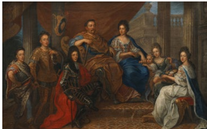
Ян III у коле сям'і, прыдворны мастак, пасля 1693, Музей Палаца Караля Яна III у Вільянуве

У фондах мінскага архіва сярод іншага знаходзяцца два неацэнныя фонды дакументаў – Архіў Сабескіх з Алавы (фонд 695) і велізарны фрагмент Архіва Радзівілаў з Нясвіжа (фонд 694), у склад якога ўвайшоў архіў Сабескіх з Жоўквы. Алаўскі архіў доўгі час лічыўся незваротна страчаным у часе бітвы за Берлін у 1945 годзе. Між тым аказалася, што пасля ўзяцця сталіцы Трэцяга Рэйха Чырвонай Арміяй гэты архіў першапачаткова трапіў у Маскву, а пасля ў Мінск. Некалькі гадоў таму стала магчымым прадставіць яго шырокаму колу грамадскасці. Неўзабаве архівісты з Мінска старанна апрацавалі матэрыялы фонда, які пачаў фігураваць пад сінатурай «фонд 695». Ужо першыя пробныя даследаванні пацвердзілі вялікую