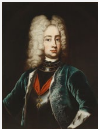
Якуб Людвік Сабескі, сілезскі мастак, пасля 1691, Музей Палаца Караля Яна III у Вільянуве

каштоўнасць дакументаў. Сярод іншага знайшлася перапіска Марыі-Казіміры з Янам Сабескім, якая лічылася страчанай, данясенні дыпламатаў і агентаў Яна III з розных еўрапейскіх сталіц, а таксама сямейная перапіска Марыі-Казіміры, складзеная ўжо пасля смерці караля. Менавіта гэтая перапіска каралевы зрабілася першым полем для сумесных навуковых дзеянняў Музея і Архіва. Падтрымка Міністэрства Культуры і Нацыянальнай Спадчыны зрабіла магчымым пачаць працу над апісаннем, перакладам, а таксама апрацоўкай крыніц з мэтай іх далейшага выдання.