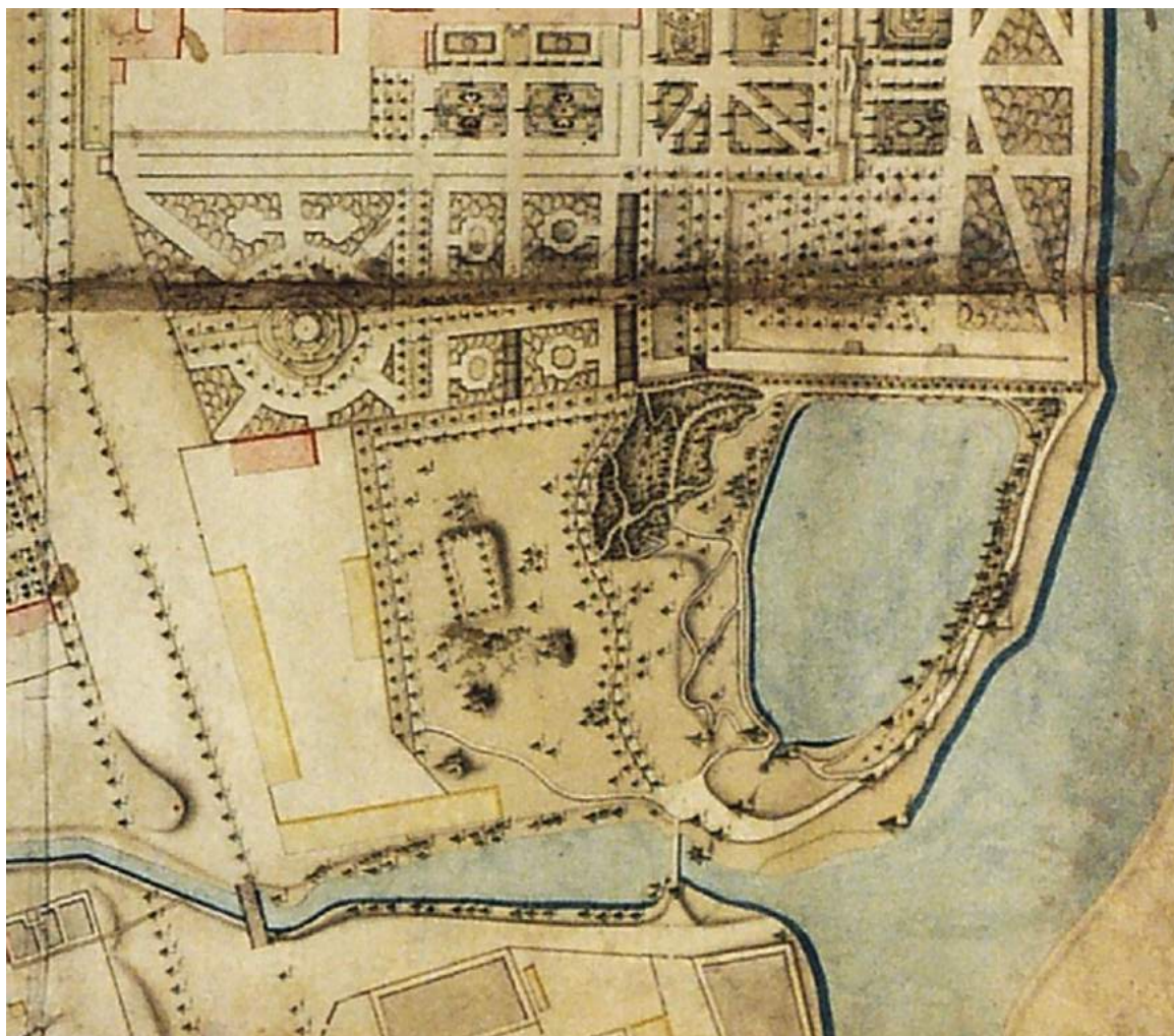
Kadr Planu Jeneralnej rezydencji wilanowskiej z lat 90 XVIII wieku. Kompozycja przestrzenna parku skoncentrowana jest wokół Stawu Południowego i reprezentuje nadal formę tzw.: Dzikiej promenady projektu Szymona Bogumiła Zuga.

Pełnię rozwoju kompozycji krajobrazowej w południowej części rezydencji wilanowskiej datować należy na wiek XIX w tym okres wielkiej rearanżacji ogrodów pałacowych w Wilanowie inicjowanej w drugiej połowie ówczesnego stulecia przez Stanisława Kostkę-Potockiego.