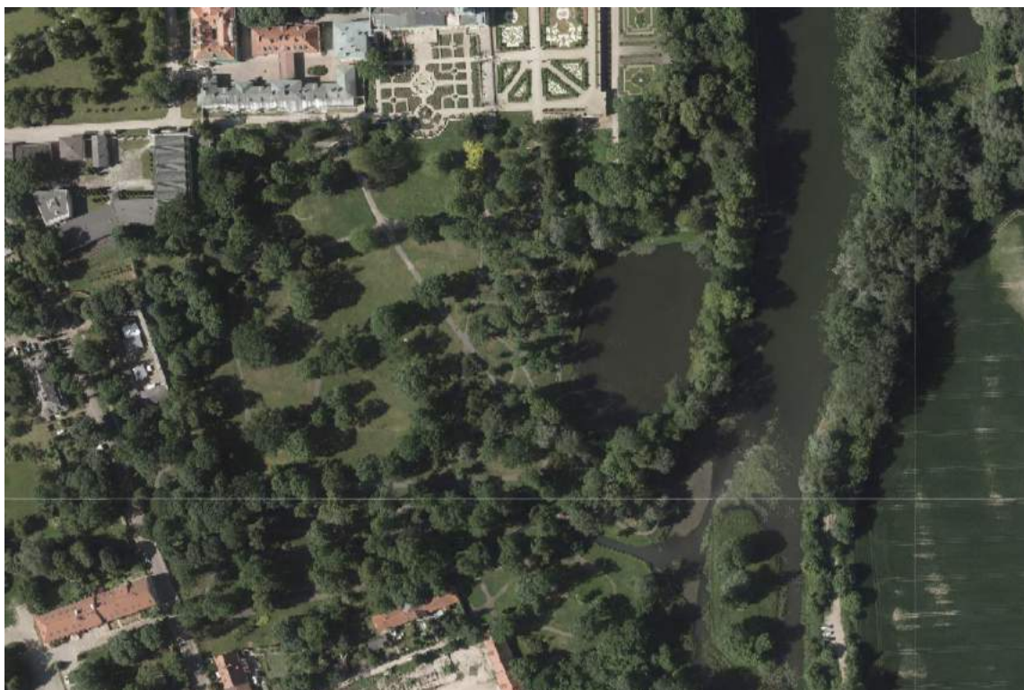
Kadr zdjęcia lotniczego z 2015 roku z widocznym Parkiem Południowym.

Największe zniekształcenia w przebiegu układu drogowego Parku Południowego zostały wywołane rewaloryzacją terenu rozpoczętą w latach 50 – 60 XX wieku. Projekt autorstwa prof. Gerarda Ciołka zakładał wprowadzenie układu drogowego prowadzonego miękką linią jednak będącego w całkowitym oderwaniu od przebiegu XIX-wiecznego (krajobrazowego). Ideowo podjęto także próbę odtworzenia złożonego układu drogowego z czasów projektu Szymona Bogumiła Zuga (zachodni brzeg Stawu Południowego) jednak i ją należy uznać za nieudaną.