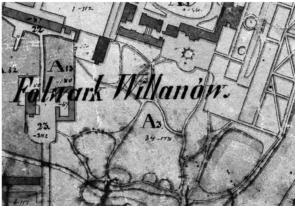
Kadr planu sytuacyjnego z połowy XIX wieku. Wartość kartograficzna planu to potwierdzenie przebiegu układu drogowego z planu Schramkego.

Do najcenniejszych źródeł ikonograficznych wskazujących na kompozycję przestrzenną Parku Południowego w XIX wieku (w warstwie parkowego układu drogowego) należą: