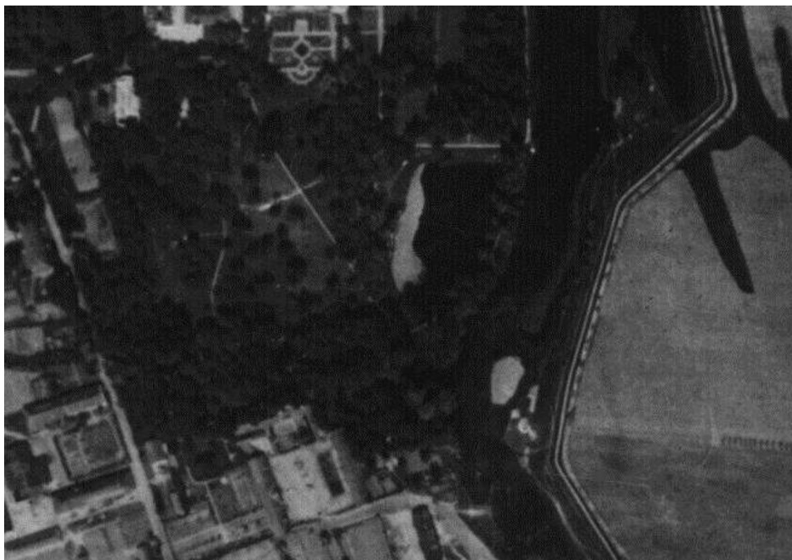
Kadr zdjęcia lotniczego z 1936 roku z Parkiem Południowym.

Kompozycyjna wartość układu drogowego w Parku Południowym ulegała stopniowej degradacji już od początku XX wieku. Stopień degradacji polegający na znacznym uproszczeniu przebiegu dróg ilustruje częściowo fotografia lotnicza z 1936 r. O ile można na niej rozpoznać zachowane zakole południowo-zachodniego odcinka „obwodnicy” centralnego wnętrza parkowego o tyle radykalnemu uproszczeniu poddano odcinek drogi łączący wyjście z Ogrodu Południowego przy pałacu (obecnie Ogród Różany) w kierunku kaskady na Potoku Służewieckim. Niezmiennie względem poprzednich dziesięcioleci czytelny jest układ drogowy okalający Staw Południowy.