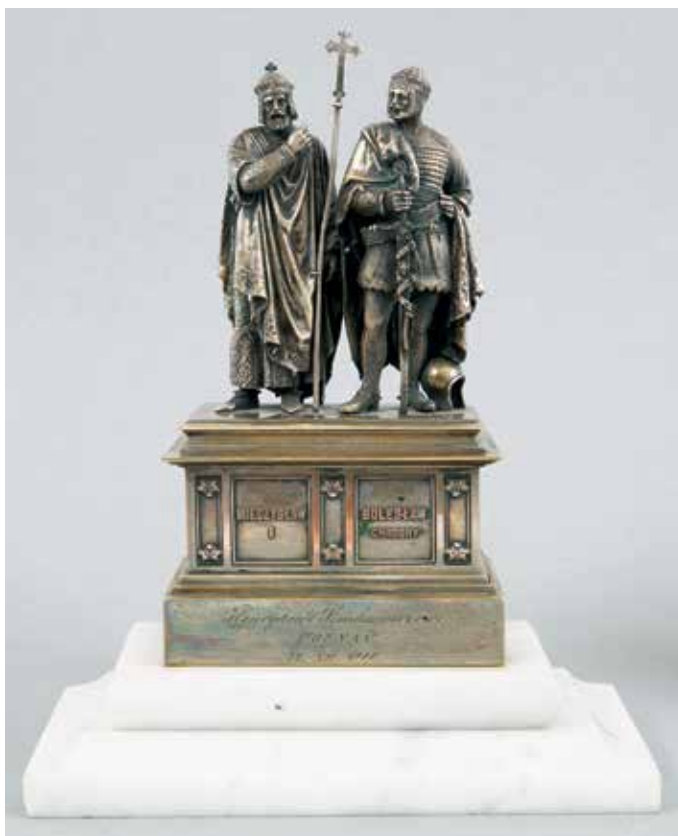
6 | „Mieszko I i Bolesław Chrobry”, 1880, mosiądz srebrzony, cynk, sztuczny marmur, wys. 24,5 cm (w zbiorach Muzeum Narodowego w Kielcach, Oddział Pałacyk Henryka Sienkiewicza w Oblęgorku)