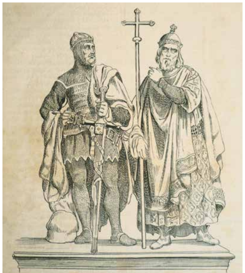
5 | Autor nieznan, „Bolesław Chrobry i Mieszko I, rzeźba Raucha”, 1845, litografia, według „Hollandsch Penning – Magazijn voor de jeugt”