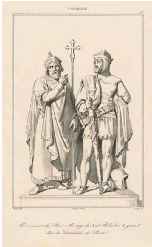
4 | Lafon według rysunku Verniera pod nadzorem Augustina-François Lemaitre'a, „Monument des Rois Miecyslwas I et Boleslas le grand dans la Cathedrale de Posen”, 1840, staloryt (w zbiorach Biblioteki Narodowej w Warszawie)

Takie przedstawienie pierwszych polskich władców było w latach Polski porozbiorowej niezwykle popularne. Świadczą o tym m.in. liczne odwzorowania poznańskiego monumetu zamieszczane w postaci rycin w wydawnictwach krajowych i zagranicznych.